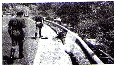
Ultima vittima Il corpo oltre il guard rail

L'associazione di motociclisti ternani ha scoperto che esiste in commercio una struttura fatta di materiali capaci di assorbire l'urto di un mezzo ma anche, ed in