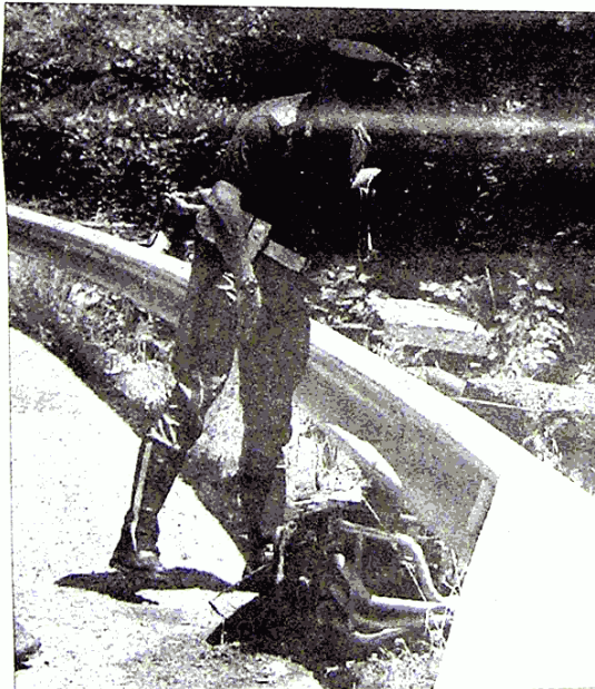
Dramma sulla strada Ciò che resta della Kawasaki del giovane dopo l'incidente sulla Flaminia

È stato il magistrato di turno, la dottoressa Guaraldi, a dare successivamente l'ok per la rimozione del corpo dal ciglio della strada. I poveri resti del ragazzo sono stati trasferiti in un'aula dell'ospedale