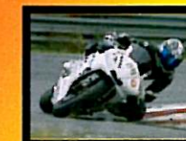
Andriotta Secondo Classificato 600 Open