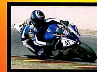
Ferrini Primo Classificato 600 Open