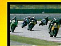
Trovò Terzo Classificato 600 Open n°27