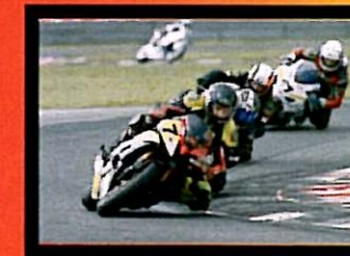
Temporin Terzo Classificato 600 Open