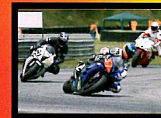
Torrissi Secondo Classificato 600 Open