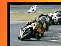
Temporin Primo Classificato 600 Open