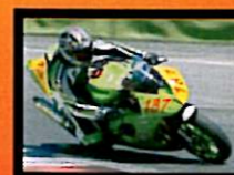
Bernasconi Secondo Classificato 1000 Open