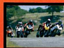
Fontanelli Terzo Classificato 1000 Open