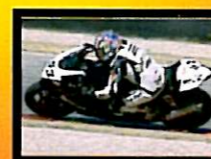
Carradori Primo Classificato 1000 Open