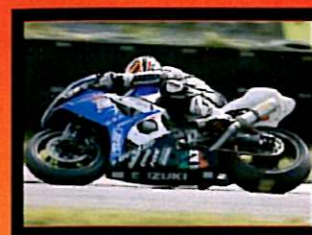
Mugnai Primo Classificato 1000 Open