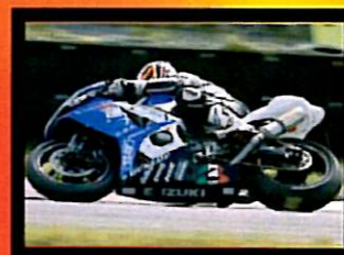
Carradori Terzo Classificato 1000 Open